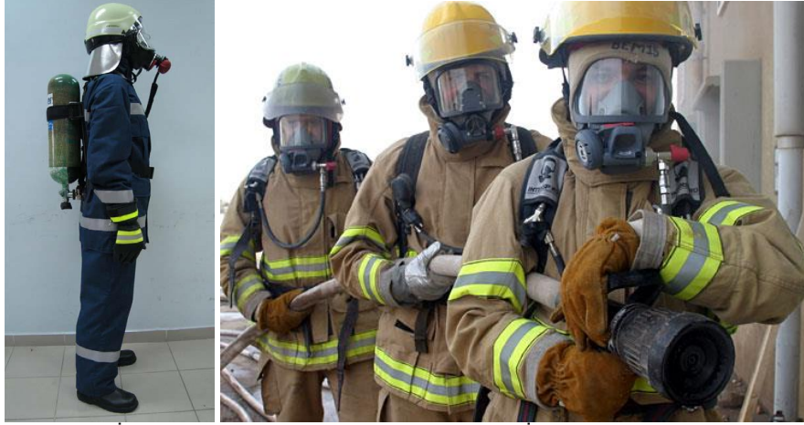
Şekil-4 İtfaiyeci Kişisel Koruyucu Donanımı ve Gönüllü İtfaiyecilerin Ekip Çalışması

Yangın yerinde oluşan başta yakıcı yüksek sıcaklık ve solunumu imkansız kılan zehirli gazlar ve diğer tehlikeler sebebi ile “itfaiyeci solunum cihazı”, nomeks veya kevlar “itfaiyeci koruyucu elbisesi”, deri veya lastik itfaiyeci çizmesi, deri veya nomeks itfaiyeci eldiveni, yanmaya dayanıklı nomeks örme itfaiyeci başlığı, darbelere dayanıklı itfaiyeci koruyucu kaskı ve diğer parçalardan oluşan “İtfaiyeci Koruyucu Donanımı” kuşanılmalıdır. Temel İtfaiyeci Eğitimi alınmalıdır. Emir komuta zinciri altında ekipler oluşturulmalıdır. İlk birinci dakikadan sonra fert olarak, eğitimsiz olarak ve donanımsız olarak yangına müdahale yapılamaz.