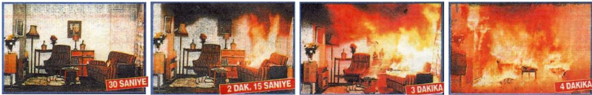
Şekil-2 Yangının Hızını Gösteren Deneden Fotoğraflar

Gönüllü itfaiyeciliğe olan ihtiyacı belirleyen üç ana faktörden bahsedebiliriz. Birincisi yangınla mücadelenin her sahasında da belirleyici olan yangının inanılmaz hızıdır . Yanıcı maddeyi tutuşma sıcaklığına ulaştıracak ısı unsuru aynı zamanda yanma reaksiyonunun ürünü olarak ta üretildiğinden kimyasal zincirleme reaksiyona sebebiyet vermektedir. Dolayısıyla bir objeden başlayan yanma olayı ürettiği ısı sebebi ile etrafındaki yanıcıları da ısıtarak tutuşma sıcaklığına ulaştırmaktadır. Tutuşan her obje yeni bir ısı kaynağı haline gelmektedir. Isı aktarımının üç çeşidi de vuku bulmakta dolayısıyla hem bitişikteki maddelere iletimle (conduction), hem daha uzaktaki maddelere sıvı veya gaz akışkanın (mesela dumanın) taşıdığı ısı enerjisi yani taşınım (convection) ve hem de yanan objenin direkt karşısındaki maddelere ok gibi gelen ısı ışınları yani ışınım (radiation) ile ısı aktarılarak yangın büyümektedir. Bu nedenlerle yangının hızı lineer değil geometriktir. Yangın ortamındaki her 10 derecelik sıcaklık artışı yangının reaksiyon hızını ikiye katlar. Yangının hızı ilerleyen saniyelerde katlanarak yani ivmeli olarak artar.