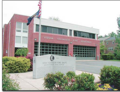
Şekil-1 Gönüllü İtfaiye İstasyonuna Bir Örnek

“Gönüllü İtfaiye İstasyonları” normal zamanlarda boştur. Yangın esnasında kendi işlerini bırakıp yangına giden gönüllü itfaiyeciler yangın sonrasında tekrar kendi işlerine dönerler. Mesleki İtfaiyeciler ile Gönüllü İtfaiyeciler arasında eğitim ve donanım açısından fark bulunmamaktadır. Keza istasyonları ve araçları da aynı özelliklere sahip olmaktadır. Belki fark olarak Mesleki İtfaiyecilerin daha sık yangınlarla muhatap oldukları için daha çabuk tecrübe edinmeleri söz konusu olabilir. Buna karşılık Gönüllü İtfaiyeler yakın yerlere müdahale edecekleri için araç yaş ortalamaları daha yüksek olabilmektedir. Mesela Almanya'da Profesyonel İtfaiye İstasyonlarında araç yaş ortalamasını genç tutmak için yeni araç aldıklarında eskisini taşraya yani Gönüllü İtfaiye İstasyonlarına vermektedirler. Şekil-1'de gönüllü itfaiye istasyonlarına bir örnek olarak ABD Kuzey Virjinya'da Vienna kasabasındaki bir istasyon görülmektedir. Bu istasyonlar yangın olmadığı zamanlarda boştur.